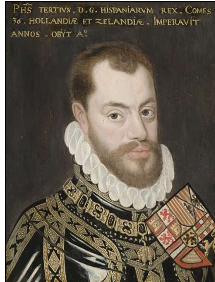
Philips de II heer van Nederland 1527-1598