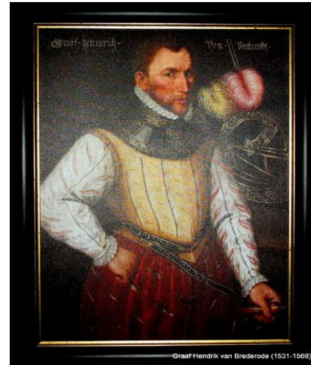
Hendrik van Brederode 1531-1568