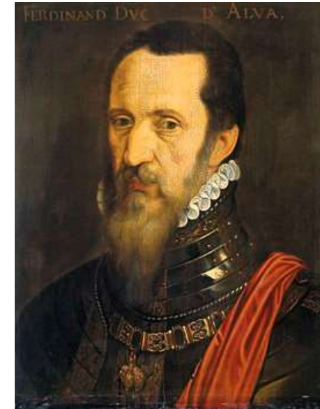
Ferdinand Alvarez de Toledo, hertog van Alva

Als Philips de II op de hoogte gebracht wordt wat er zo in de Lage landen plaats vindt, dan stuurt hij de Hertog van Alva op 5 april 1567 met een leger naar Nederland om orde op zaken te brengen. Op het harnas van Alva staan twee afbeeldingen gegraveerd. Op een van deze afbeeldingen zien we Alva gekniel bij het kruis met Jezus. Hij beloofd Jezus de ketters in Holland een lesje te leren en de afvalligen te doden.