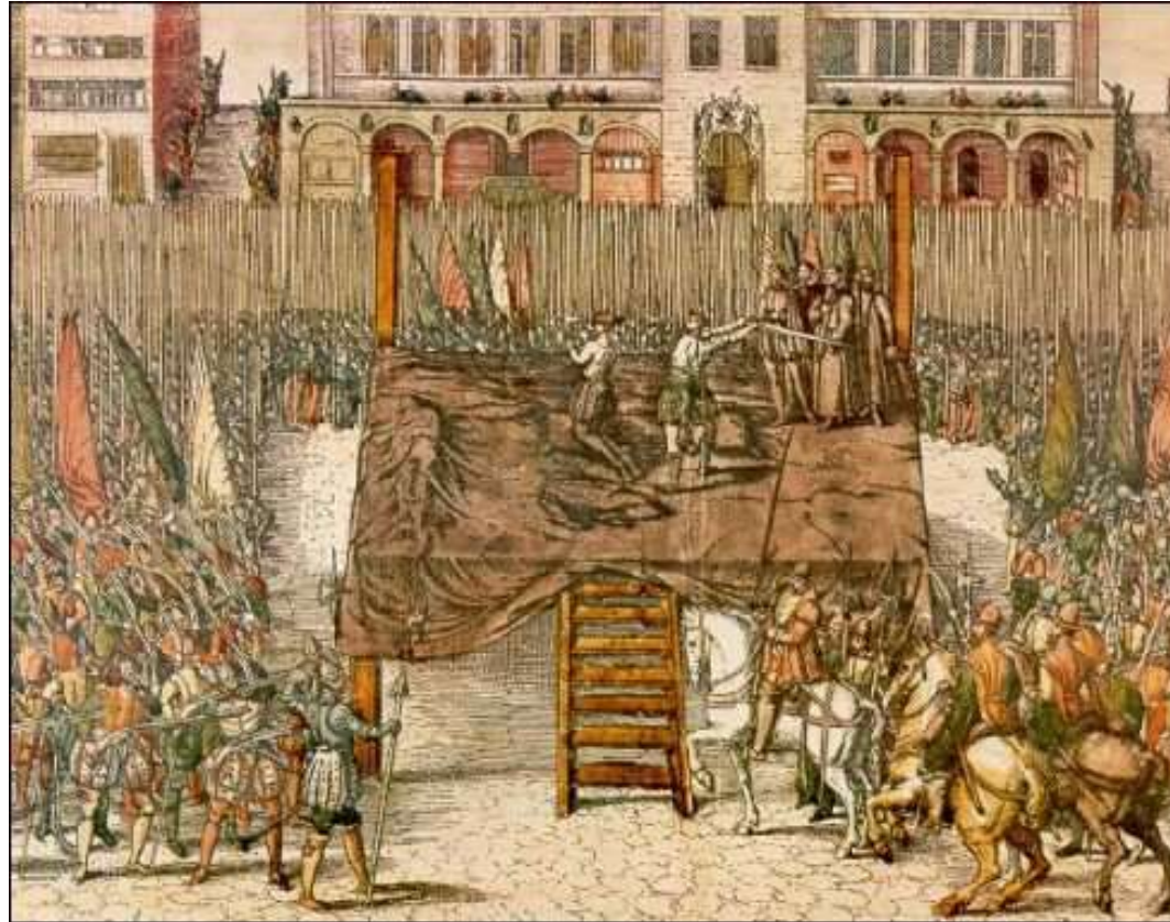
Onthoofding op de markt van Brussel van graaf van Egmond en graaf van Horne 5 juni 1568

Alva komt op 22 augustus 1567 aan in Brussel. Hij stelde een Bijzonder Gerechtshof in, de zogenaamde Raad van Beroerten. Dit gerechtshof werd door het volk al snel Bloedraad genoemd. Niet voor niets: naar schatting werden er 6.000 tot 8.000 protestanten door de Raad van Beroerten veroordeeld. De graven Van Egmond en Horne worden als voorbeeld onthoofd op de markt van Brussel.