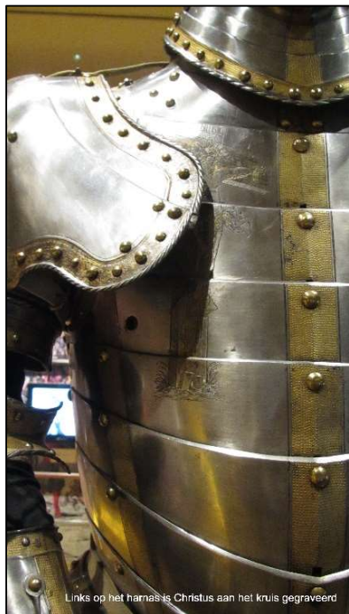
Harnas van Alva

Eerder schreef ik dat Willem van Oranje pas in verzet kwam tegen Koning Philips de II, nadat zijn zoon prins Philip Willem, in het voorjaar van 1568 werd ontvoerd door Philips de II. Met zijn verzet begon de 80-jarige oorlog op 23 mei 1568 en eindigde op 15 mei 1648.