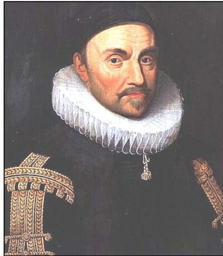
Willem I van Oranje 1533-1584