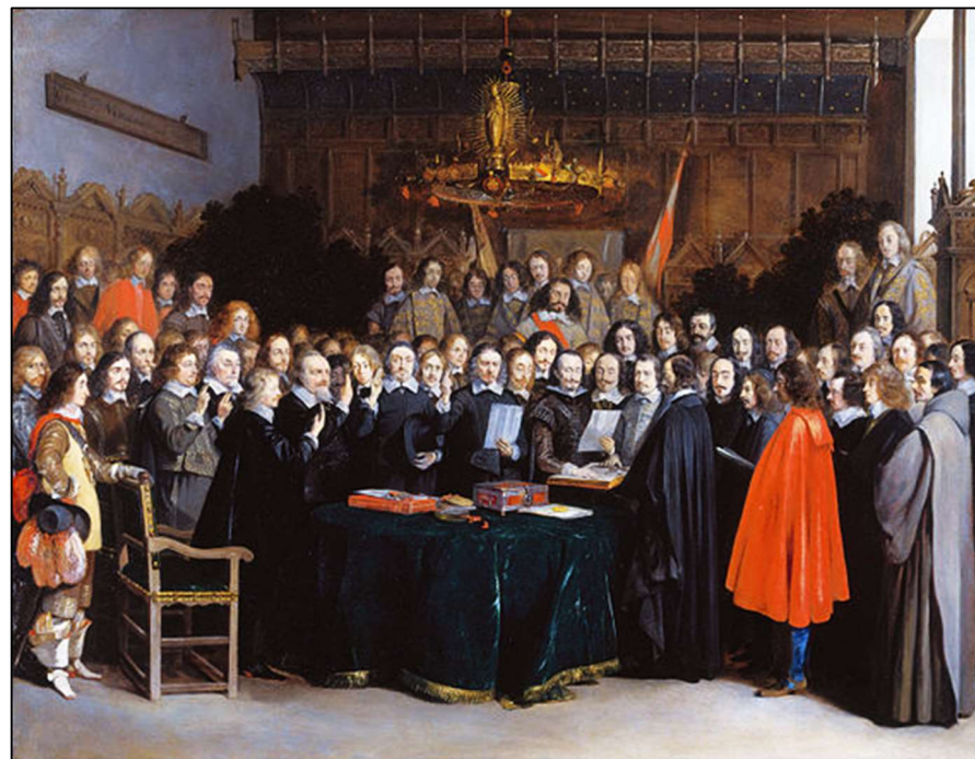
Spaanse en Nederlandse onderhandelaars