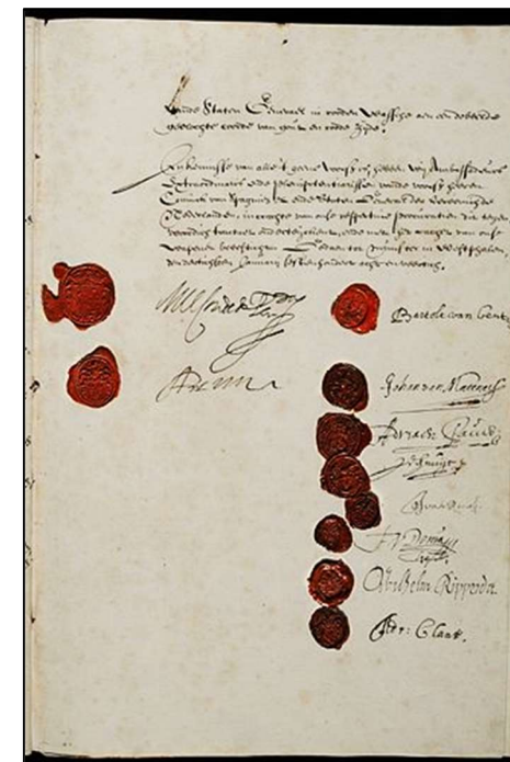
Laatste folio van het verdrag

In Munster werd op 15 mei 1648 de vrede gesloten tussen Spanje en de Republiek der Verenigde Provinciën, hierdoor kwam een einde aan de tachtigjarige oorlog. Het verdrag beslaat 40 folio's, waarvan de laatste hierboven is afgebeeld, met daarop de handtekeningen en cachetten van de onderhandelaars.