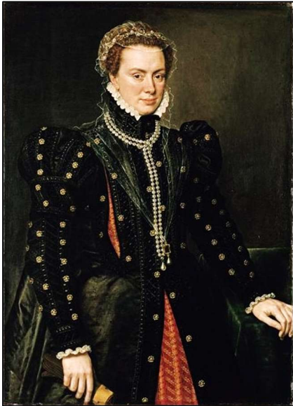
Margretha van Parma 1522-1586